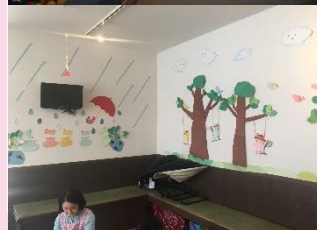
みんなの実家@まちや 風景